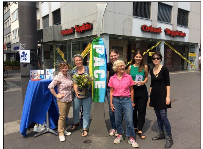
Gruppenbild der FNF-Frauen vor der Bertha-Stele in ihrem Friedensfahnen-Geburtstagskleid

Am 09. Juni 2018 feierten wir Bertha von Suttners 175. Geburtstag mit einer Aktion an der – wie soll es auch anders sein – Bertha von Suttner-Stele am Bertha-von-Suttner-Platz in Bonn. Zu diesem Anlass versammelten sich FNF-Frauen mit einem Infostand an der Stele. Ziel war es, die vorbeikommenden Passant*innen zu Bertha von Suttner zu befragen und gegebenenfalls aufzuklären, wer diese Frau war, nach der der gleichnamige Platz 1949 benannt wurde. Denn das Wissen um die Namensgeberin des (Verkehrs-)Knotenpunktes zwischen der Bonner Altstadt und dem Bonner Zentrum ist längst nicht allen Bonner Bürger*innen bekannt! Der engagierten Pazifistin wurde als erste Frau im Jahr 1905 der Friedensnobelpreis verliehen. Ihr berühmtes Werk „Die Waffen nieder!“ hat auch heute nichts an seiner Aktualität verloren. So verbrachten wir einige fröhliche und sonnige Stunden an der Stele, um mit interessierten Menschen über Bertha ins Gespräch zu kommen. Als besonderes Geburtstagsgeschenk der Stadt Bonn konnten wir uns noch über die neu angebrachten Straßenergänzungsschilder freuen. Auf diesen ist nun zu lesen: „Bertha von Suttner (1843-1914), Schriftstellerin u. Pazifistin, erhielt als erste Frau den Friedensnobelpreis 1905“. Ein ganz besonderer Dank geht an dieser Stelle an die großzügigen Spender*innen, die die Schilder finanziert haben und an alle FNF-Frauen, die sich für die Aufhängung der Schilder eingesetzt haben!