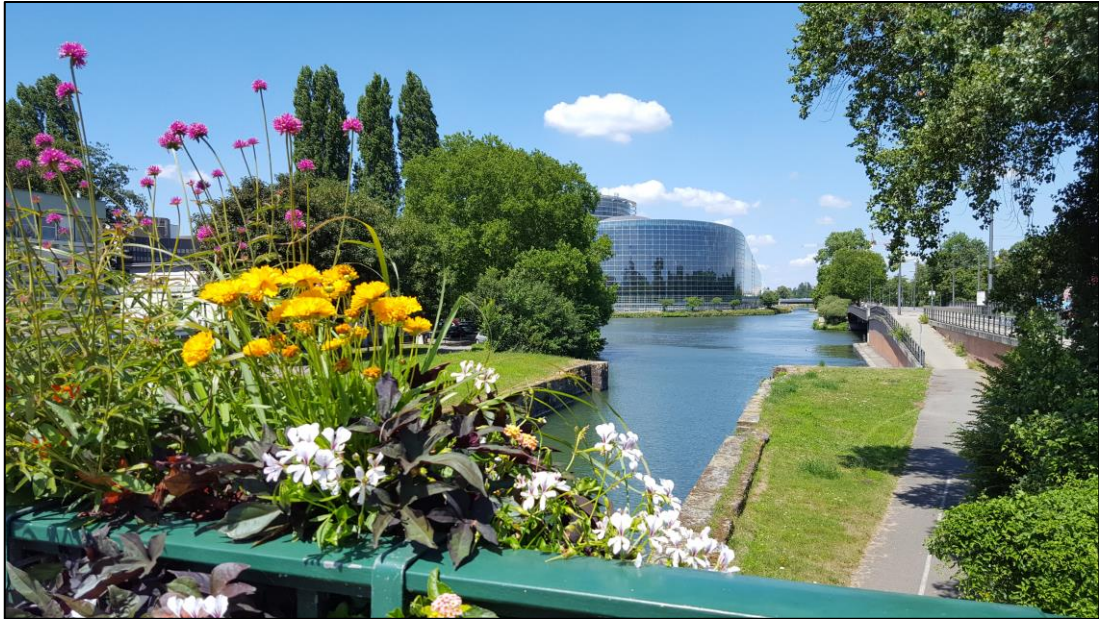
Ein Sommergruß aus Straßburg – im Hintergrund das Europäische Parlament

DAS FNF WÜNSCHT ALLEN MITGLIEDERN, FREUND*INNEN, UNTERSTÜTZER*INNEN UND KOLLEG*INNEN EINEN SCHÖNEN UND ERHOLSAMEN SOMMER!